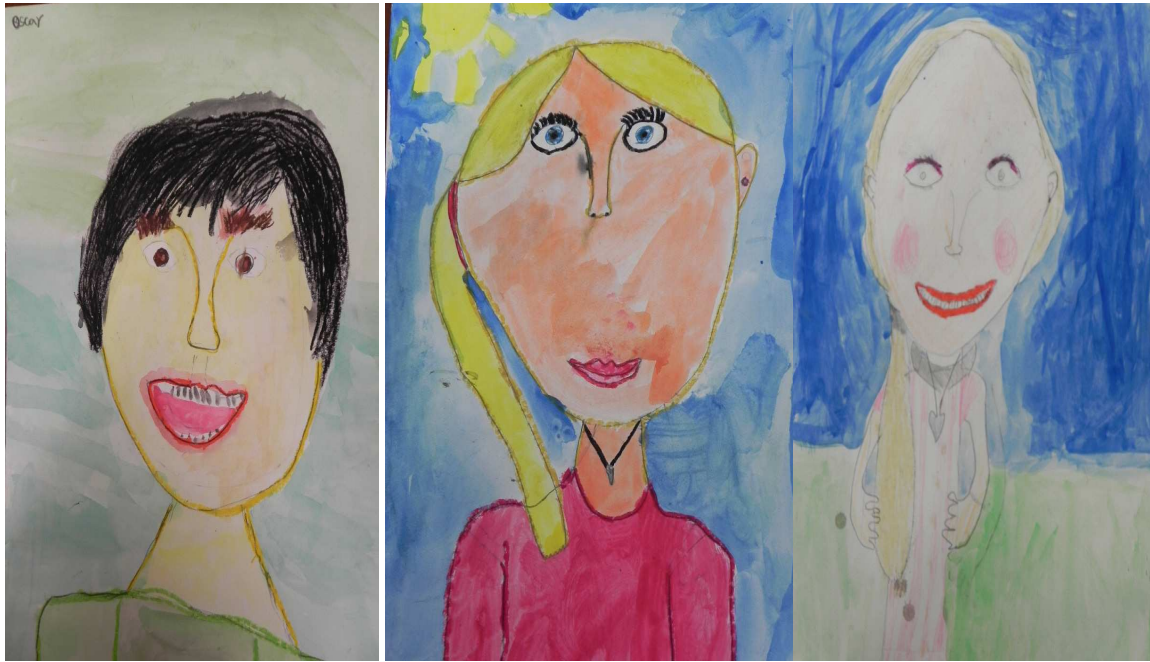
Bildmappar med självporträtt (inspirerade av Amadeo Modigliani) år 2-3 och 4-5