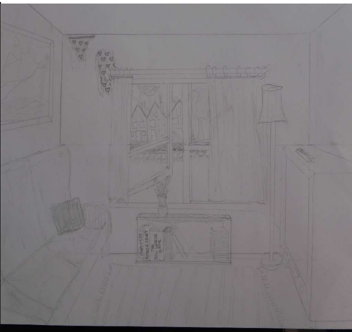
Form och perspektivuppgifter år 6-9