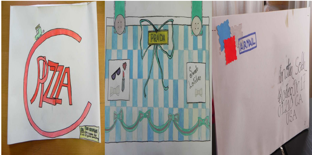
Bildmappar Egen väskdesign År 6-9